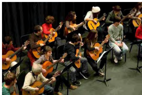
Agrupación de Guitarras