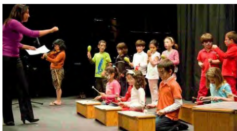
Alumnos de Música y Movimiento