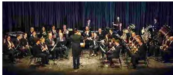
Banda Municipal de Música