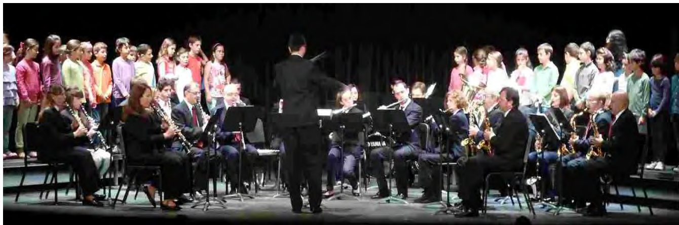
Coro Infantil y Banda Municipal de Música

La Escuela Municipal de Música de Majadahonda “Enrique Granados” es la primera en fundarse en la Comunidad de Madrid con más de 35 años de funcionamiento. A lo largo de estos años han pasado por sus aulas estudiantes de todas las edades. Como centro formativo que depende de la Concejalía de Educación, Cultura y Juventud, la Escuela está integrada en la Red de Escuelas Municipales de Música y Danza de la Comunidad de Madrid.